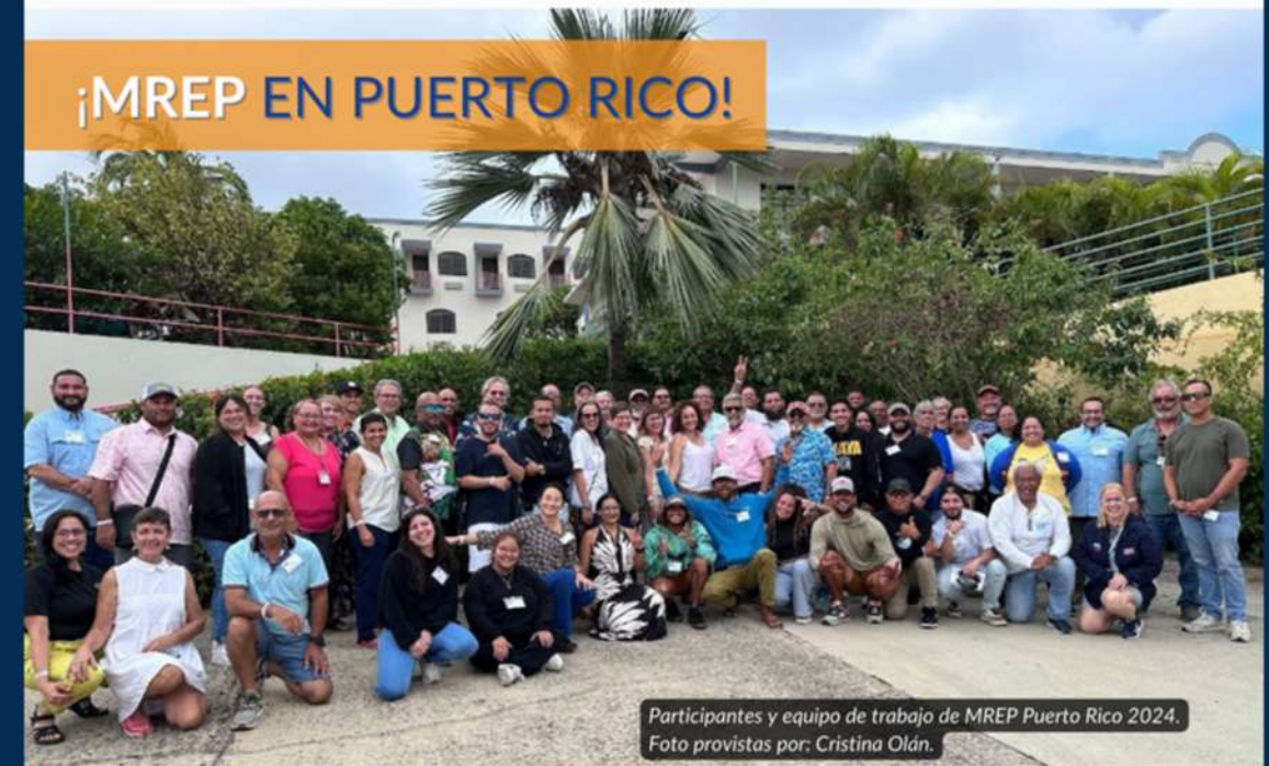
Participantes y equipo de trabajo de MREP Puerto Rico 2024.

El Programa de Educación sobre los Recursos Marinos (MREP, en inglés) ofreció su taller durante el 22-25 de agosto de 2024 en Fajardo, Puerto Rico. Ciencia y manejo pesquero, evaluación de los abastos, biología de los peces, ecosistemas, participación de los pescadores en los procesos de toma de decisiones, entre otros temas, fueron cubiertos durante el taller.