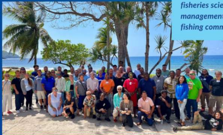
Participants of the 2024 Marine Resource Education Program in St. Croix, U.S. Virgin Islands.

Fisheries scientists and managers visited St. Croix, U.S. Virgin Islands, to share knowledge about fisheries science and the fisheries management process, with local fishing communities.